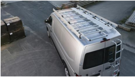
Bagażnik dachowy (aluminium)