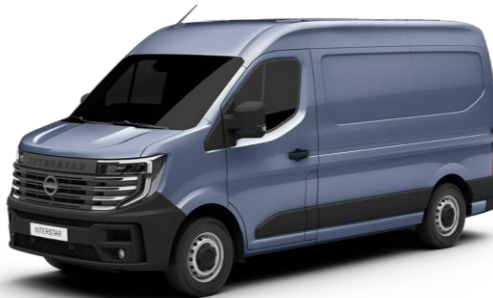
jasnoniebieski - J47