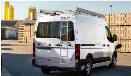
Stalowa drabina Na tylne drzwi