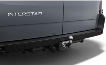
Hak holowniczy (pakiet)