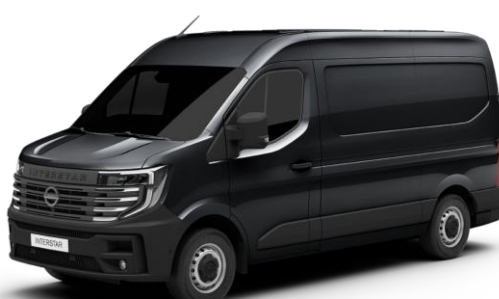
czarny - 676