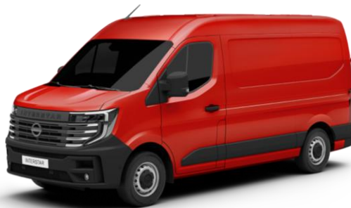
czerwony - 071