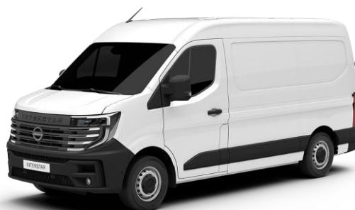
biały - QNG