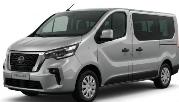
szary Highland – KQA