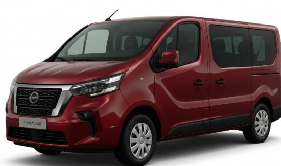
czerwony Carmin – NPF