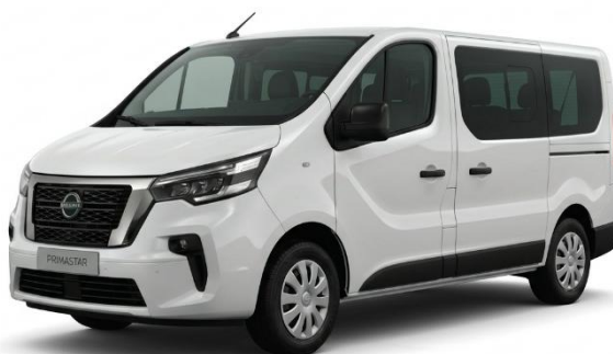
biały – 369/389

Lakiery metalizowane / perłowe – 2 600 zł