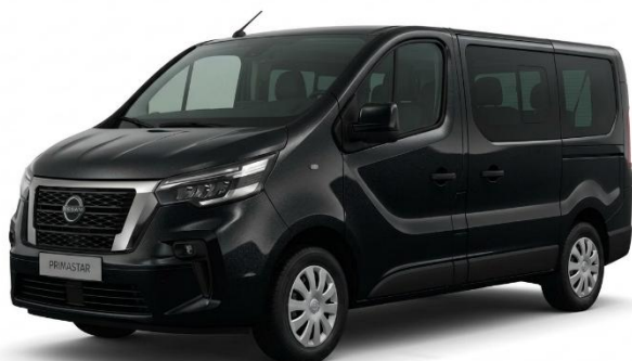
czarny – D68

Lakiery metalizowane / perłowe – 2 600 zł