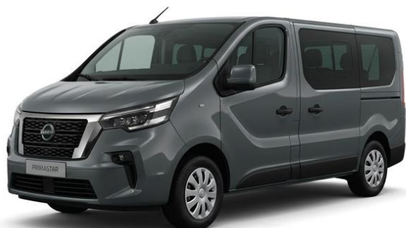
ciemnoszary – KPW