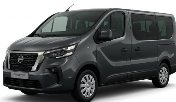
szary – KNA